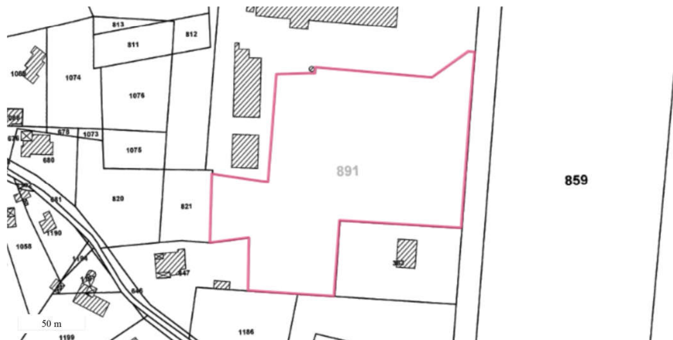
Périmètre du SIS Parcelles cadastrales - IGN